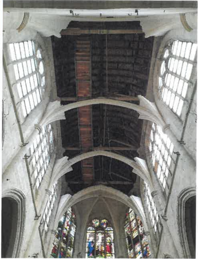
Vue générale du clocher et du haut-vaisseau du chœur et du haut-vaisseau depuis le chœur