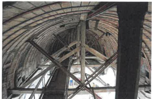
Détail des baies romanes murées du clocher et vue de la voûte lambrissée peinte